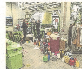
Im Textilen Zentrum Haslach

dem den weit über die regionalen Grenzen hinaus bekannten Webermarkt. Textilschaffende aus ganz Europa präsentieren dabei im alten Ortsteil „auf der Stelzen“ hochwertige Produkte und individuelle Kreationen. Parallel dazu wird auch die Garn- und Materialmesse Faserzone abgehalten. Zahlreiche