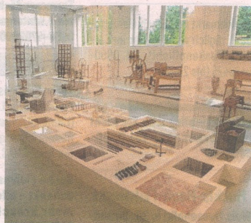
Das Webereimuseum befindet sich in Haslach.

lineshop erstehen. „Mit Ihrem Einkauf unterstützen Sie unser Kulturprojekt in dieser schwierigen Zeit“, so die Betreiber. Auch die Villa sinnenreich entführt die Besucher wieder in eine Welt zwischen Illusion und Wirklichkeit. Auf Grund der Corona-bedingten Besucherbegrenzung ist ak-